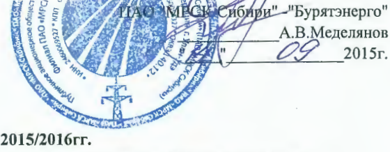
ГРАФИК временного отключения потребления на 2015/2016гг. по Филиалу ПАО "МРСК Сибири" - "Бурятэнерго" на территории Северобайкальского участка Республики Бурятия