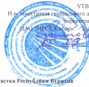
ГРАФИК временного отключения потребления на 2018/2019гг. по Филиалу ПАО "МРСК Сибири" - "Бурятэнерго" на территории Северобайкальского участка Республики Бурятия